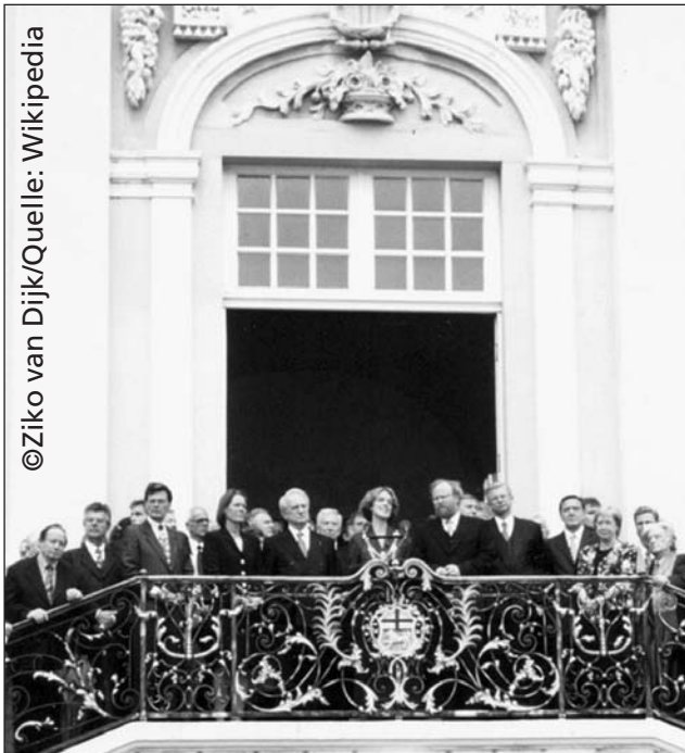
Ein Kernfeld politischer Bildung ist die landesbezogene Zeitgeschichte. Hier Einführung des langjährigen nordrhein-westfälischen Ministerpräsidenten Johannes Rau in das Amt des Bundespräsidenten, Bonn 1999

trachtet, die in alle relevanten Kernfelder integriert werden können.