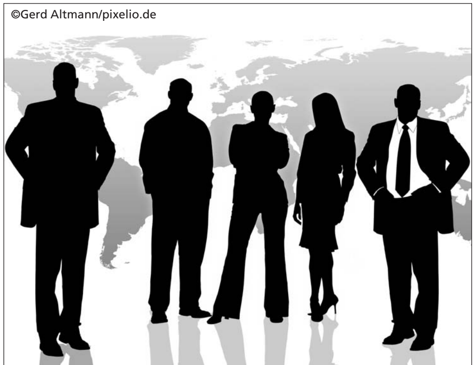
Wer sind die Teilnehmer/-innen an politischer Bildung?